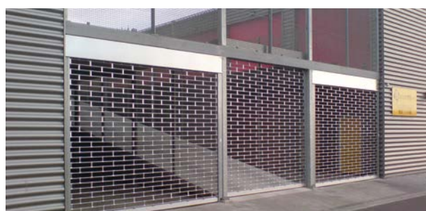
Type portails roulants