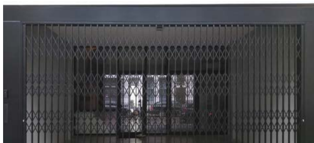
Type portes à grille rétractile