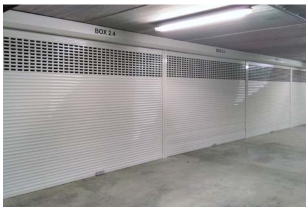
Type volets roulants